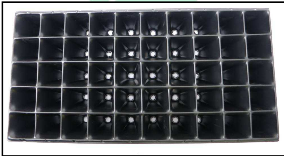
Vista aérea de la bandeja

La capacidad de la bandeja en tierra es de 95 centímetros cúbicos, por lo que, con un viaje de tierra (6 metros cúbicos), se logran llenar 63.157 bandejas. Mientras que si se está trabajando con turba, la capacidad de la bandeja es de 1,6 kilogramos; entonces, de un bulto (59 Kg aprox.), se pueden obtener el material para llenar 36 bandejas aproximadamente.