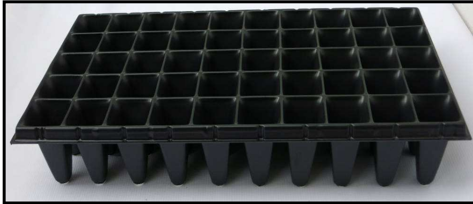
Vista frontal de la bandeja

Con el uso de la bandeja de 50 cavidades, se reducen los costos de producción, se aumenta la calidad del material vegetal que esté produciendo y se contribuye a la conservación del medio ambiente. Esto, debido a que esta bandeja, es un elemento 100% reciclable y reutilizable. Este elaborado con poliestireno de calibre 55, el cual permite reutilizar el elemento de 20 a 25 veces, bajo condiciones normales de uso y reduce costos de transporte, ya que este material le otorga un peso de tan solo 200 gramos a la bandeja. Además, se trata de un material completamente inerte (No tóxico), por lo que se puede lavar completamente, sin preocuparse por la migración de componentes nocivos.