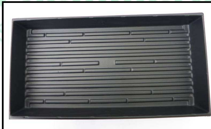
Vista aérea de la bandeja

La capacidad de la bandeja en tierra es de 7500 c.c.; por lo que con un viaje de tierra (6 metros cúbicos) se logran llenar 800 bandejas. Mientras que si se trabaja con turba, la capacidad de la bandeja es de 1,7 kilogramos, por lo que de un bulto (59 Kg aproximadamente), se pueden llenar hasta 34 bandejas aproximadamente.