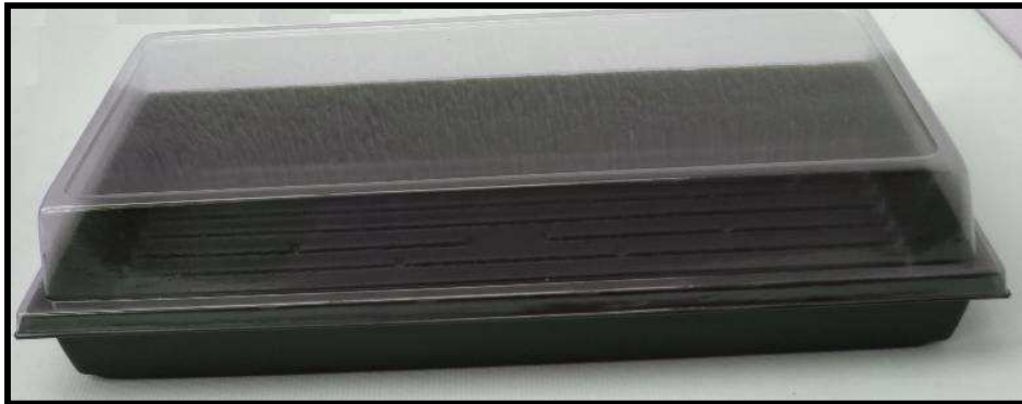
Vista frontal de la bandeja

Con la bandeja base, los tiempos de germinación de las semillas se disminuyen, por lo que se genera un aumento en la capacidad de producción. Facilita las labores de transporte y manipulación para las bandejas de germinación, brindándole comodidad y seguridad. Su sistema de cierre hermético, aumenta la humedad relativa del ambiente, acelerando los procesos que se dan dentro de la semilla, por lo que germinaran rápidamente. Las propiedades del poliestireno rígido (PR) de calibre 55 con que esta elaborada la bandeja, permiten reutilizar el elemento, ya que se trata de un elemento no toxico, 100% lavable y además, es 100% reciclable, por lo que contribuye a la conservación del medio ambiente. Su peso ligero de 214 gramos , disminuye costos de transporte, además de facilitar la movilización del material vegetal.