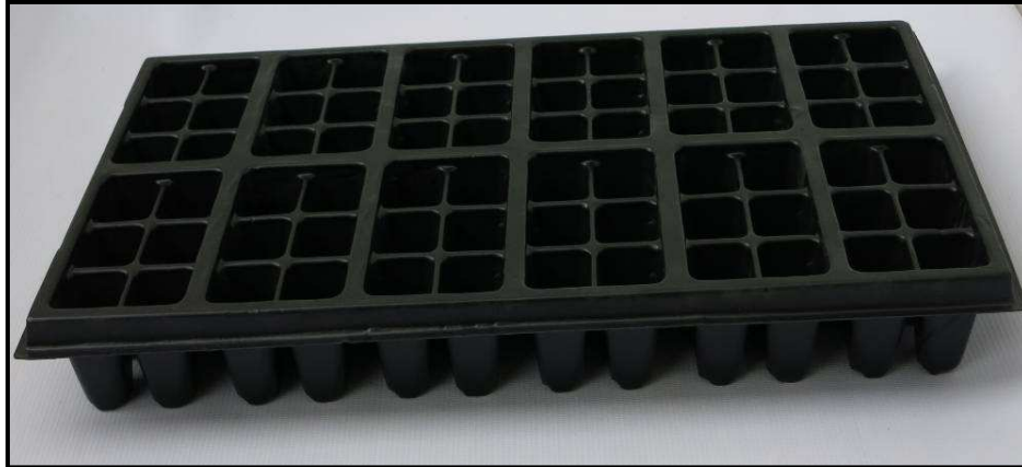
Vista frontal de la bandeja

Con la bandeja de 72 cavidades, los costos de producción se reducen, se aumentará la calidad de su material vegetal y se contribuye a la conservación del medio ambiente. Esto, debido a que esta bandeja, es un elemento 100% reciclable y reutilizable. Esta elaborada con poliestireno rígido de calibre 55, el cual le da una durabilidad aproximada de 18 meses, con un rendimiento entre 15 y 20 ciclos de cultivos de 28 días, bajo condiciones normales de uso. Además, los costos de transporte disminuyen, ya que este material le otorga un peso de tan solo 216 gramos a la bandeja. Como se trata de un material completamente inerte (No tóxico), es 100% lavable y no presenta migración de componentes químicos.