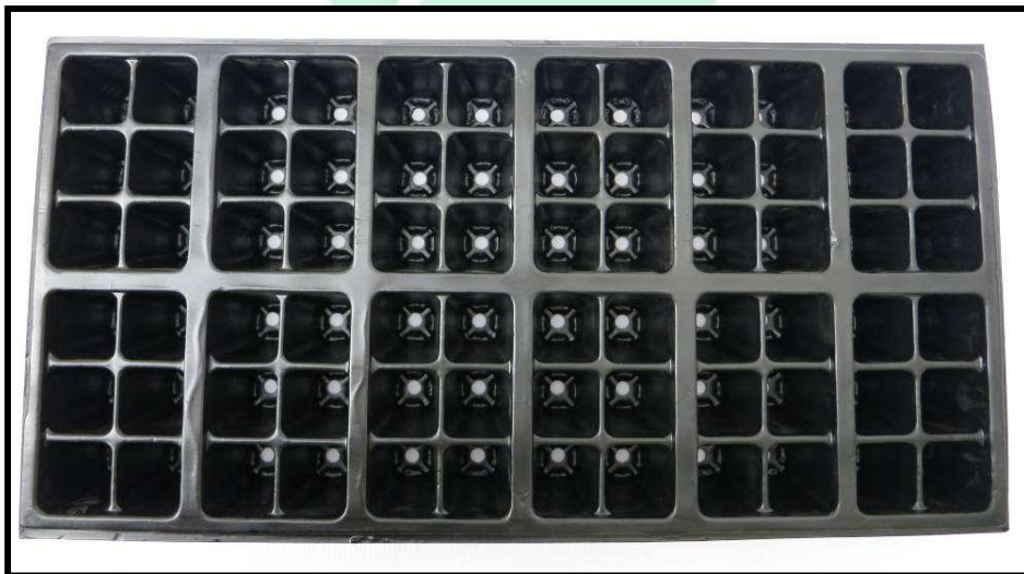
Vista aérea de la bandeja

La capacidad de la bandeja en tierra es de 47,6 c.c.; por lo que con un viaje de tierra (6 metros cúbicos) se logran llenar 126.050 bandejas. Mientras que si se está trabajando con turba, la capacidad es de 1,6 kilogramos; por lo que de un bulto (59 Kg aproximadamente), se pueden llenar hasta 50 bandejas aproximadamente.