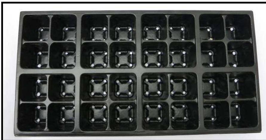
Vista aérea de la bandeja