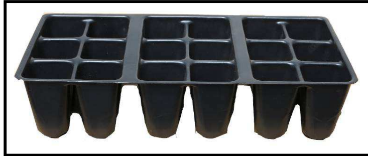
Vista frontal de la bandeja

El uso de la bandeja de 18 cavidades, le permite disminuir costos de producción, y a la vez contribuir a la preservación del medio ambiente; ya que se trata de un elemento 100% reciclable y reutilizable. Así mismo, se reducen los esfuerzos en el transporte del material vegetal, gracias a su peso liviano de 230 gramos . El poliestireno de calibre 55 con que está elaborada la bandeja, permite reutilizar el elemento de 15 a 20 veces, bajo condiciones normales de uso. Además de esto, las características del material, permiten lavar completamente la bandeja sin generar preocupación por la migración de componentes tóxicos, ya que se trata de un material completamente inerte.