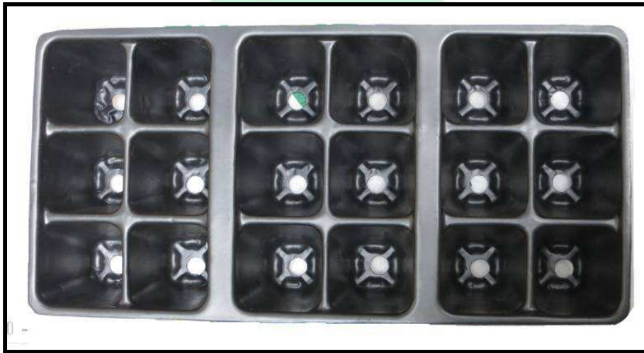
Vista aérea de la bandeja

La capacidad de la bandeja en tierra es de 23 ml; por lo que con un viaje de tierra (6 metros cúbicos) se logran llenar 260.869 bandejas. Mientras que, si se está trabajando con turba, la capacidad de la bandeja es de 0,25 kilogramos, por lo que de un bulto (59 Kg aproximadamente), se pueden llenar hasta 257 bandejas aproximadamente.