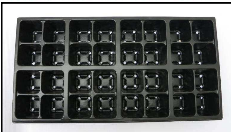
Vista aérea de la bandeja