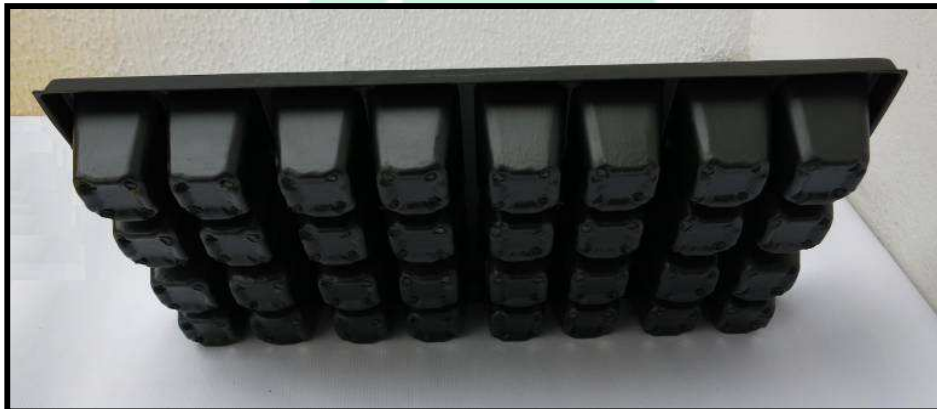
Vista general de la bandeja

La capacidad de la bandeja en tierra es de 141 c.c.; por lo que con un viaje de tierra (6 metros cúbicos) se pueden llenar 42.553 bandejas. Mientras que si se está trabajando con turba, la capacidad de la bandeja es de 1,6 kilogramos; por lo que de un bulto (59 Kg aproximadamente), se pueden llenar hasta 38 bandejas aproximadamente.