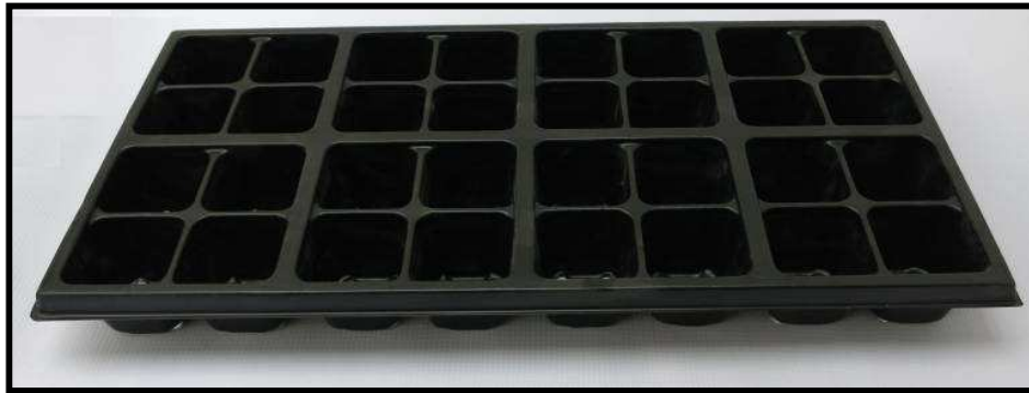
Vista frontal de la bandeja

Con el uso de la bandeja de 32 cavidades, se logran disminuir costos de producción, y a la vez contribuir a la preservación del medio ambiente; ya que se trata de un elemento 100% reciclable y reutilizable. Los esfuerzos en el transporte del material vegetal se reducen, gracias al peso liviano de 230 gramos . El poliestireno de calibre 55 con que está elaborada la bandeja, permite reutilizar el elemento de 15 a 20 veces, bajo condiciones normales de uso. Además de esto, gracias a las características del material, la bandeja se puede lavar completamente sin preocuparse por la migración de componentes tóxicos, ya que se trata de un material completamente inerte.