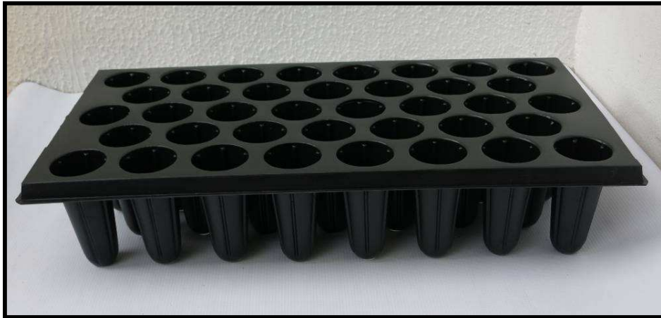
Vista frontal de la bandeja

Con el uso de la bandeja de 38 cavidades, se logran disminuir costos de producción, aumentar la calidad del material vegetal que esté produciendo y contribuir a la conservación del medio ambiente. Esto se debe a que, se trata de un elemento 100% reciclable y reutilizable. El diseño de sus cavidades, direcciona el crecimiento de las raíces, por lo que las plantas desarrollan un sistema radicular excepcional, lo cual disminuye las perdidas por mortalidad a la hora de la plantación se reducen esfuerzos en el transporte del material vegetal, gracias a su liviano peso de 360 gramos .