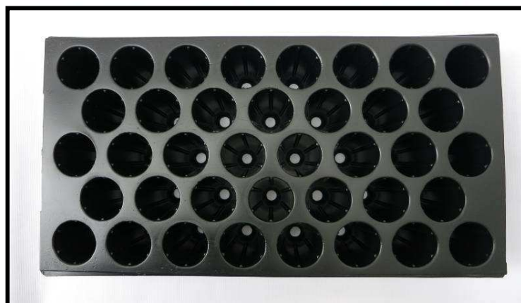
Vista aérea de la bandeja

La capacidad de la bandeja en tierra es de 141 centímetros cúbicos, por lo que, con un viaje de tierra (6 metros cúbicos), se logran llenar 42.553 bandejas. Mientras que si se está trabajando con turba, la capacidad de la bandeja es de 2,2 kilogramos, entonces, de un bulto (59 Kg aprox.), se logran llenar 26 bandejas aproximadamente.