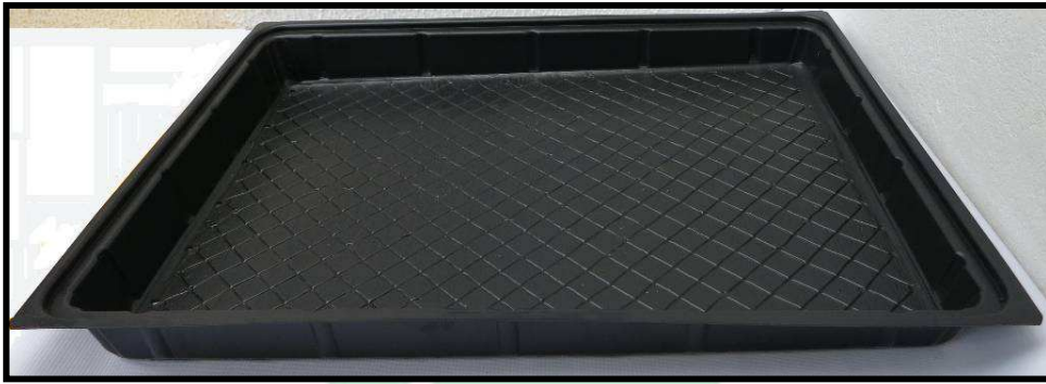
Vista frontal de la bandeja

Con el uso de la bandeja forrajera, los costos de producción se reducen y se contribuye a la conservación del medio ambiente, ya que se trata de un elemento 100% reciclable y reutilizable. Gracias al poliestireno rígido (PR) de calibre 90 con que está elaborada la bandeja, el elemento se puede reutilizar, con la confiabilidad de trabajar con materiales resistentes al trabajo pesado y de un peso ligero de 1080 gramos . Además de esto, las características del material, permiten lavar completamente la bandeja sin preocuparse por la migración de componentes tóxicos, ya que se trata de un material completamente inerte y reutilizable.