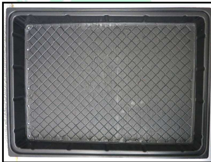
Vista aérea de la bandeja

La capacidad de la bandeja en tierra es de 1700 c.c.; por lo que con un viaje de tierra (6 metros cúbicos) se logran llenar 3.529 bandejas. Mientras que si usted está trabajando con turba, la capacidad de la bandeja es de 4,5 kilogramos. Entonces, de un bulto (59 Kg aproximadamente), se pueden llenar hasta 13 bandejas aproximadamente.